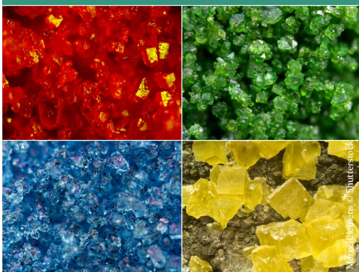
Marcel Jaspers © Shutterstock