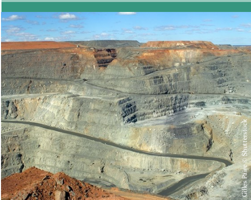
Gilles Raine © Shutterstock